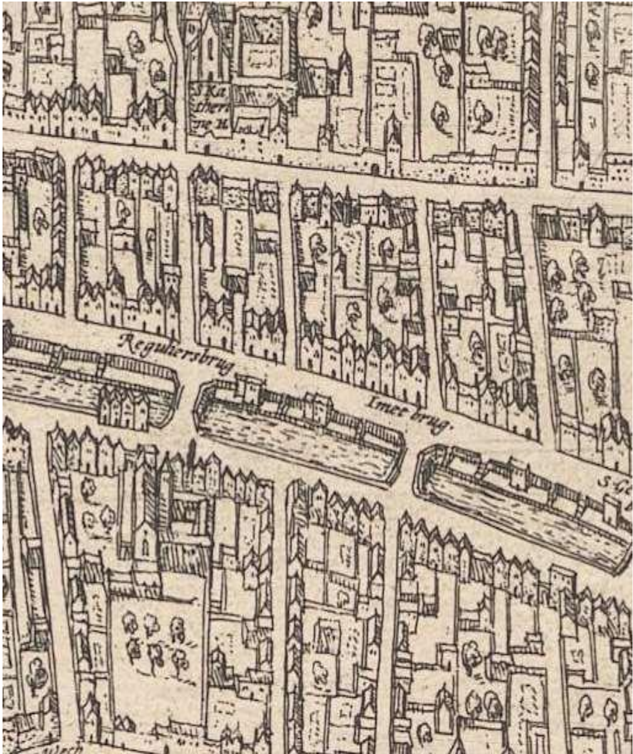
Grote uitsnede kaart Hogenberg (±1572) op basis van kaart Melchisdech van Hoorn (1569/1570)