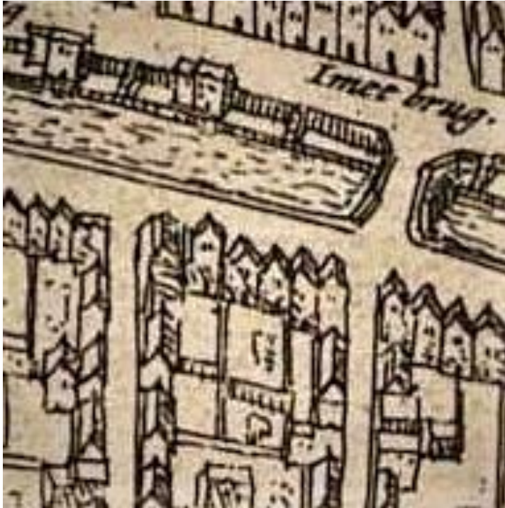
Detail kaart Hogenberg: situatie Brandstraat/Smeestraat. Tweede pand vanaf Brandstraat (zuidwaarts) De Drie Schabellen. Midden onder, de hoeve. 1

Links tegen de achterzijde van het huis De Drie Schabellen treffen we een aanbouw aan. Dit huisje, volgens een oude beschrijving een 'camer ( begane grond met zolderverdieping) met de afmetingen 3 meter breed en zes meter diep, is het geboortehuis van Paus Adriaan. Dit nederige huisje heeft een verbinding met de Oudegracht. Rechts van het pand De Drie Schabellen bevindt zich een poortgebouw. 2 Zowel De Drie Schabellen , het poortgebouw (later Oudegracht 269) is in 1570 in bezit van de familie Van Overmeer, houtkoper en schepen. In het begin van de jaren zeventig van de 16 de eeuw verrijst er in de tuin van De Drie Schabellen tegen de dan al bestaande hoeve (zie kaart), die eveneens in bezit is van deze gefortuneerde familie (het gehele perceel strekte zich uit tot aan de Springweg), een groot pand van 6 meter breed en 18 meter diep bestaande uit drie verdiepingen. Dit huis staat in de registers te boek als het huis De Lange gang en zal in het midden van de 19 de eeuw worden gesloopt. Zowel De Drie Schabellen , het huis De Lange Gang als de hoeve (gedurende de 17 de eeuw verbouwd tot atelier) is door de eeuwen heen altijd in bezit geweest van één familie.